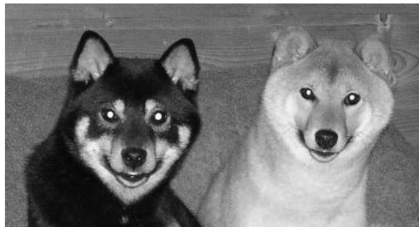
Kita og Titt tei