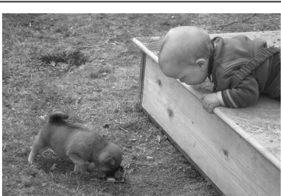
Hei, det er min bil.....

Vi har også vedtatt at medlemmer som melder seg inn etter 30/6 skal betale halv pris 1. året.