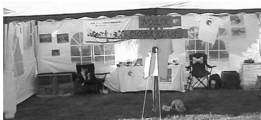
Klubbens stand på Bjerke