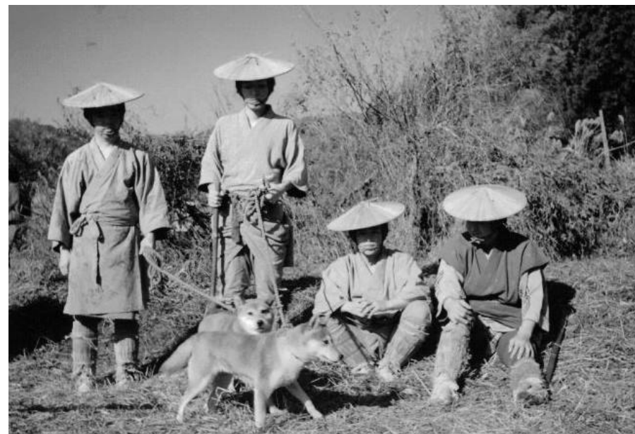
Bilde fra Herr Yamamotos film