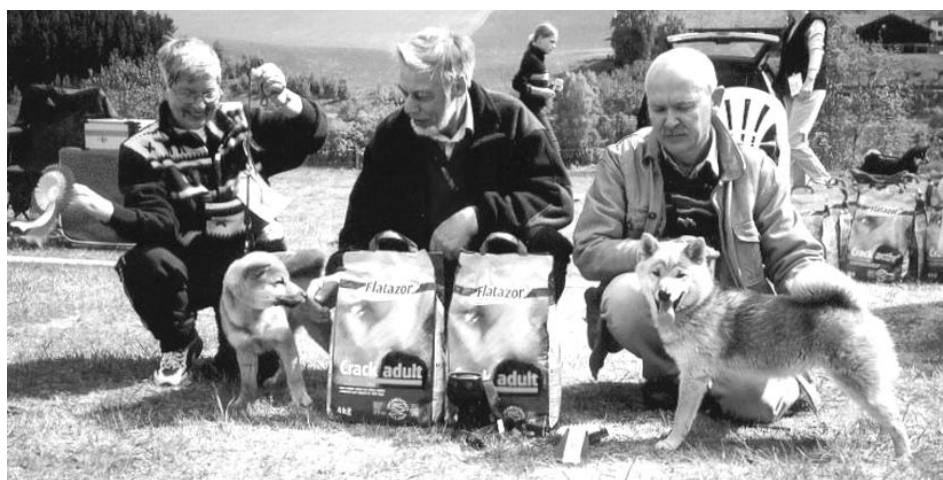
T.v BIR valp Kamikaze, t.h. BIM valp Østbylias Edle Aya