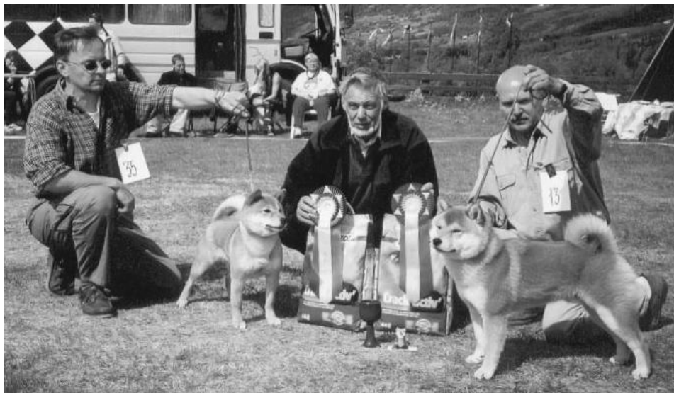
T.v. BIM Soldoggens Beninesa, t.h. BIR Chiharu av Enerhaugen