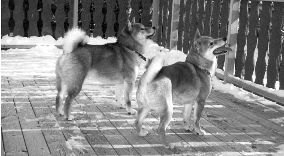
Kom nærmere, kom nærmere... så blir det kanskje skjære til lunsj.....

Når ovennevnte beskrivelse av symptomene kjennes igjen, finnes det ingen tvil om at sykdommen har fått feste og behandling kan være resultatløs. For størst mulig sjanse til å behandle en person som er rammet av hundeeiersykdommen, bør samtalerapi settes inn allerede ved det første symptomet. Umyndiggjørelse er ikke å anbefale, tross at det har vært vanlig fram til våre dager. Vitenskapelige undersøkelser har vist at hundeeieren ytterst sjelden utgjør noen fare for samfunnet og at pasienten selv ikke opplever sin sykdom som spesielt besværlig. Da de som regel er ganske fornøyde og glade, kan man med god samvittighet la dem holde på og se på dem som et pittoresk innslag i vårt samfunn.