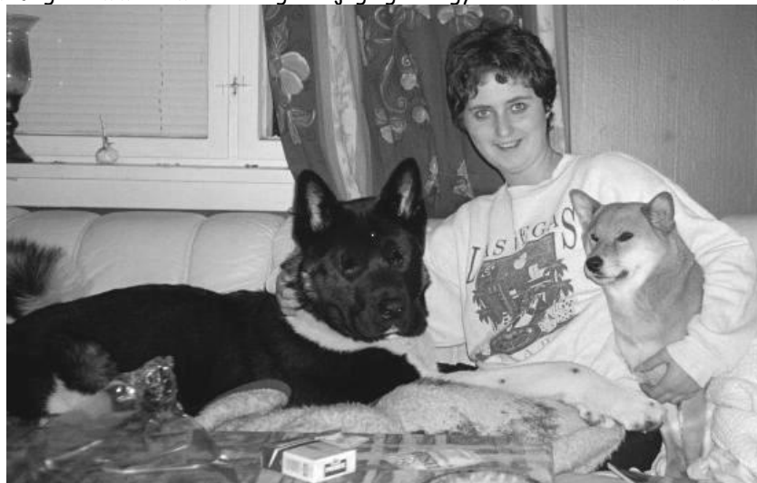
Ellers vil jeg ønske alle Shiba venner en god sommer