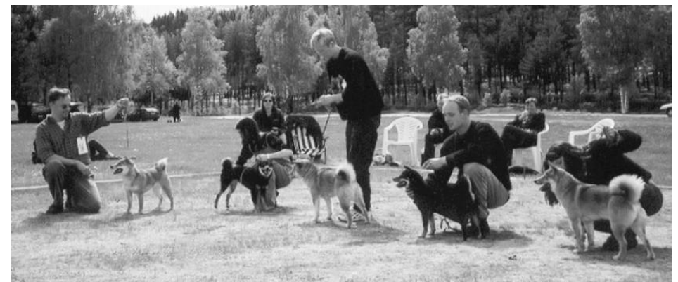
Beste avlsklasse; Soldoggens Beninesa Med følgende avkom;