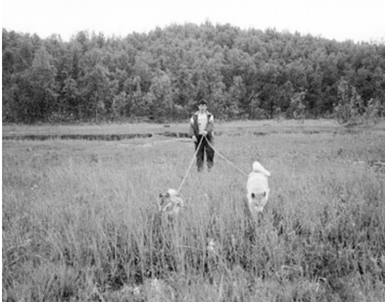
Når man har 2 ettersøkshunder, kan man stille med to-spann...