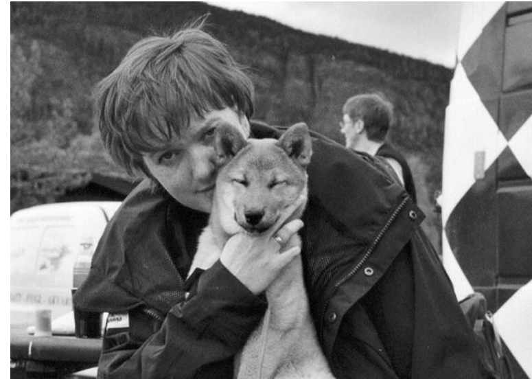
Koselig å være på Shibaspesial...

Middels stor hanne av utmerket typ. Vel kjønnspregad. Mycke bra hode og uttr. Bra hals. Utm. framstell. En tanke smal i lendpartiet. Rør seg vel. Trivlig temp. 1AUK 1AUKK HP 2VK CK 3BHK