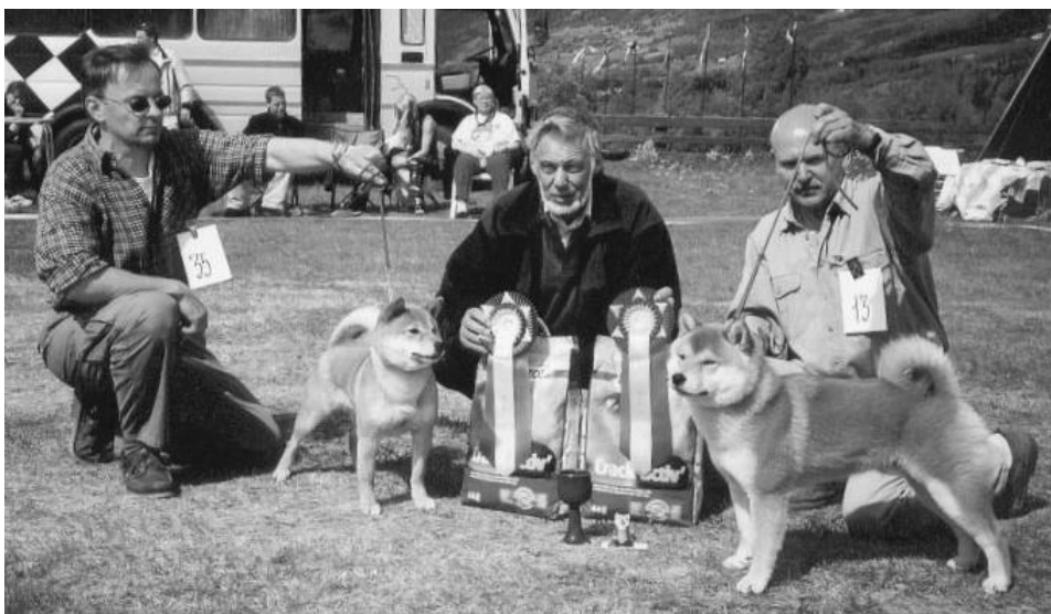
T.v. BIM Soldoggens Beninesa, t.h. BIR Chiharu av Enerhaugen