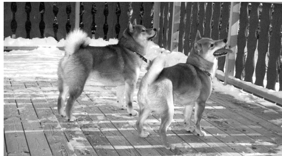
Kom nærmere, kom nærmere... så blir det kanskje skjære til lunsj.....

Når ovennevnte beskrivelse av symptomene kjennes igjen, finnes det ingen tvil om at sykdommen har fått feste og behandling kan være resultatløs. For størst mulig sjans til å behandle en person som er rammet av hundeeiersykdommen, bør samtaleterapi settes inn allerede ved det første symptomet. Umyndiggjørelse er ikke å anbefale, tross at det har vært vanlig fram til våre dager. Vitenskapelige undersøkelser har vist at hundeeieren ytterst sjelden utgjør noen fare for samfunnet og at pasienten selv ikke opplever sin sykdom som spesielt besværlig. Da de som regel er ganske fornøyde og glade, kan man med god samvittighet la dem holde på og se på dem som et pittoresk innslag i vårt samfunn.