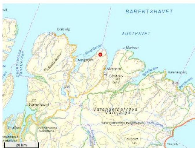
Figur 1. Oversiktskart med planområdet grovkalisert i rødt.

Hamnefjell vindkraftverk trinn 1 er utbygd og ble satt i drift i 2017 (51,75 MW installert effekt og rundt 4000 fullasttimer i årsproduksjon). I tillegg er det gitt konsesjon til et byggetrinn 2 nordover på 68,25 MW i installert effekt. Trinn 2 ligger klar til utbygging og har reservert nett, men må vente på nødvendig oppgradering av transmisjonsnettet til Øst-Finnmark. Trinn 3 er også avhengig av økt nettkapasitet til Øst-Finnmark, noe Statnetts konsesjonssøknad for 420 kV fra Lebesby til Seidafjellet muliggjør. Oversikt over utbyggingstrinnene ved Hamnefjell vindkraftverk er vist under (figur 2).