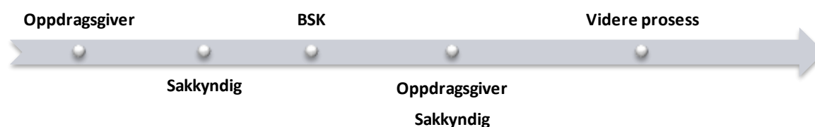
Figur 1.1 Forenklet saksgang

Av svarbrevet går det fram hvem av kommisjonsmedlemmene som har behandlet saken, og hvilke bemerkninger kommisjonens medlemmer eventuelt har hatt. Først når en rapport er gjennomgått av kommisjonen kan den legges til grunn for vedtak etter barnevernlovens kapittel 4, jf. bvl. §§ 4-3 fjerde ledd, 7-17 annet ledd, 7-23 første ledd første punktum og 7-24 tredje ledd.