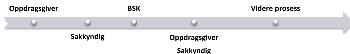
Figur 1.1 Forenklet saksgang

Av svarbrevet går det fram hvem av kommisjonsmedlemmene som har behandlet saken, og hvilke bemerkninger kommisjonens medlemmer eventuelt har hatt. Først når en rapport er gjennomgått av kommisjonen kan den legges til grunn for vedtak etter barnevernlovens kapittel 4, jf. bvl. §§ 4-3 fjerde ledd, 7-17 annet ledd, 7-23 første ledd første punktum og 7-24 tredje ledd.