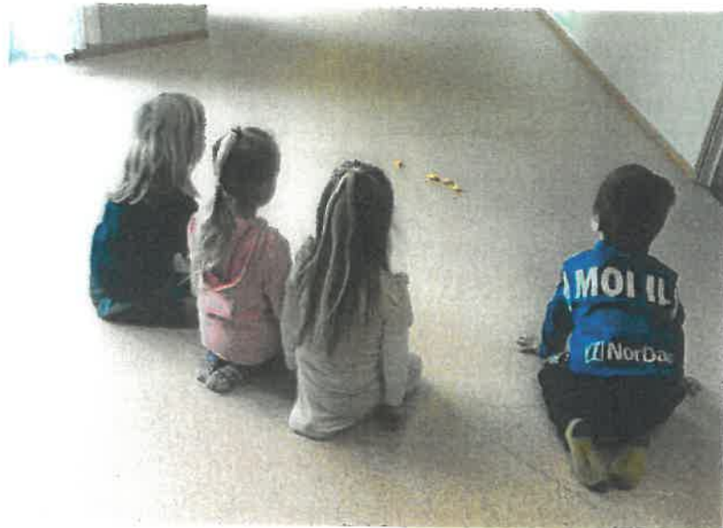
Barnehagebarn er ofte på besøk.

Vi har trådløst internett. Velg "Publikum" og bruk koden "Publikum"