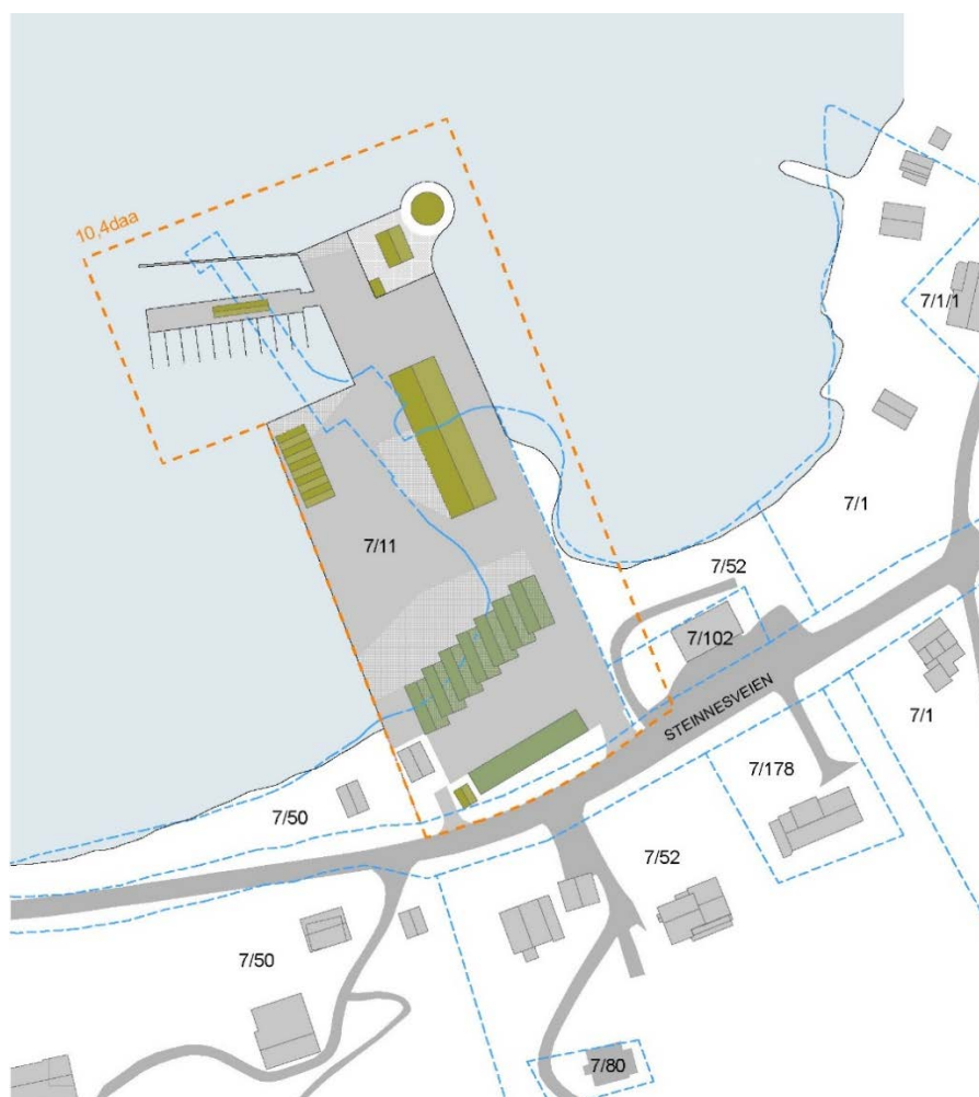
Figur 1: Plangrenser i oransje for planid 201905, reguleringsplan for Rolo Eiendom AS, Dåfjord, Gbnr. 7/11.

I medhold av PBL §12-8 kunngjøres herved oppstart av en ny reguleringsplan for Rolo Eiendom AS, Dåfjord som omregulering og utvidelse av reguleringsplan 200801, boliger på eiendommen 7/11.