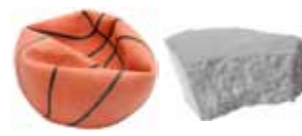
Øydelagte leiker og bitar med isopor