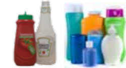
Plastflasker for vaskemiddel/ shampoo/dressing