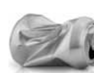
Boksar utan pant