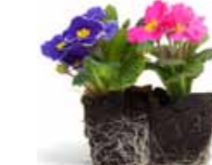
Potteplanter og blomster