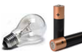
Småbatteri og lyspærer