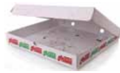
Øskjer og pappemballasje