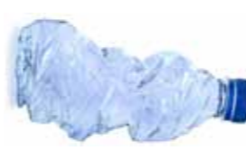
Plastflasker utan pant