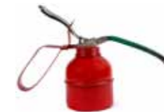
Spillolje og oljefilter