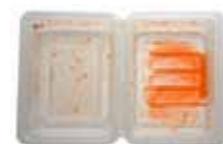
Tilgrisa plast og papir