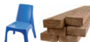
Hardplast og trevirke