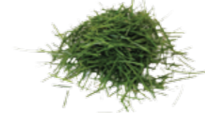
Gras og lauv