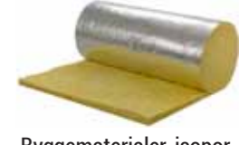
Byggematerialer, isopor, vindauge og golvbelegg