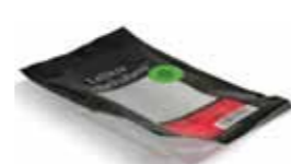
Rein mat-emballasje av plast