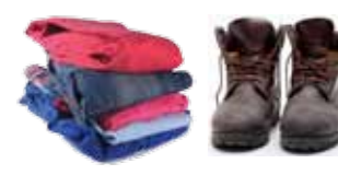
Tekstilar og sko (UFF-kontainer)