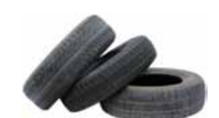
Bildekk og bildelar