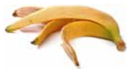
Frukt, grønnsaker og skrell