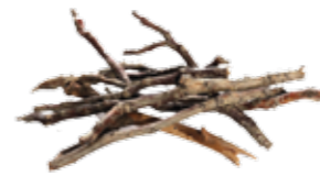
Kvister og greiner