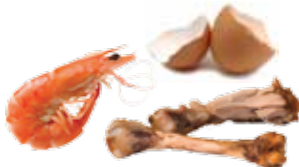
Skalldyr, eggeskal og småbein