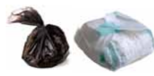
Hundeposar og alle typar bleier