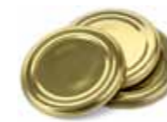
Lok og korker av metall