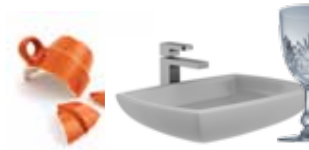
Keramikk, porselen og krystall