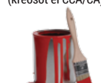
Maling, beis og lakk