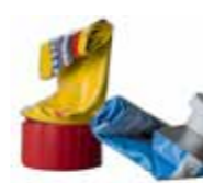
Tome kaviar- og majonestubar