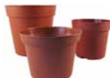
Blomsterpotter av plast