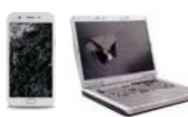
Mobiltelefonar og datautstyr