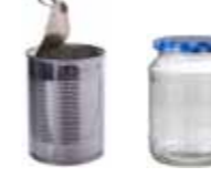
Hermetikkboksar og syltetøyglas