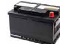
Bil-, traktor-, og mopedbatteri