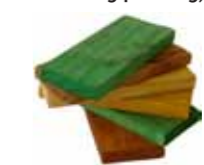
Impregner trevirke (kresot el CCA/CA)