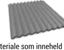
Materiale som inneheld asbest (www.vor.no/sorteringsguide for riktig pakking)