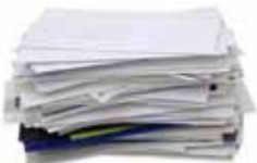
Kopipapir og brev