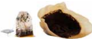
Kaffigrut, filter og teposar