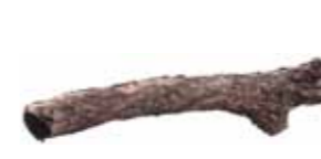
Trestammar (under 25 cm diameter)