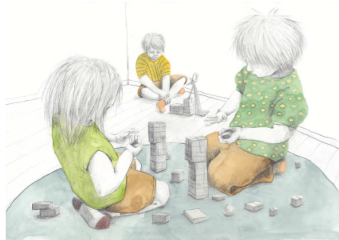
Fra barnebokern "Matthias er alene", illustrasjon: Ane Tollerød Fosse