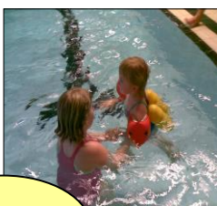
Å svømme sammen