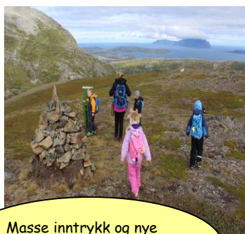
Masse inntrykk og nye begreper på tur til Stortinden.