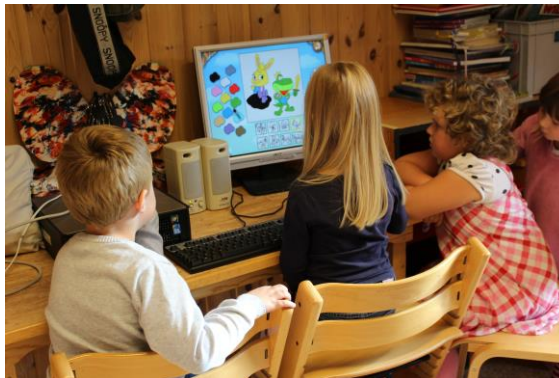
(Lek og læring på data)

Samarbeidsmøtene er overordna fellesmøter der ledelsen fra barnehage og skole deltar. Møtet om høsten sjekker ut at rammer, økonomi og organisering er på plass før oppstart av førskolen. Samarbeidsmøtene planlegger foreldremøtene og fordeler ansvar og arbeidsoppgaver. Nye deltakere blir satt inn i planens målsetting, innhold og metodikk. Det skal være minst 2 samarbeidsmøter i året: 1 møte i forkant av førskolen om høsten og 1 møte i etterkant om våren.