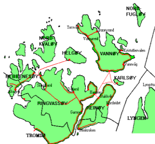
(Utsnitt Karlsøy kommune med omegn)