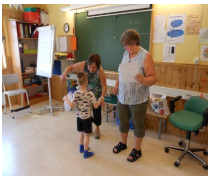
(Hilser på rektor og lærer vi får i 1.kl)

«Fra eldst til Yngst» (Veileder for å styrke overgangen mellom barnehage og skole omfang. Førskoletilbudet er også begrunnet i St.melding 16: «Tidlig innsats for livslang læring»