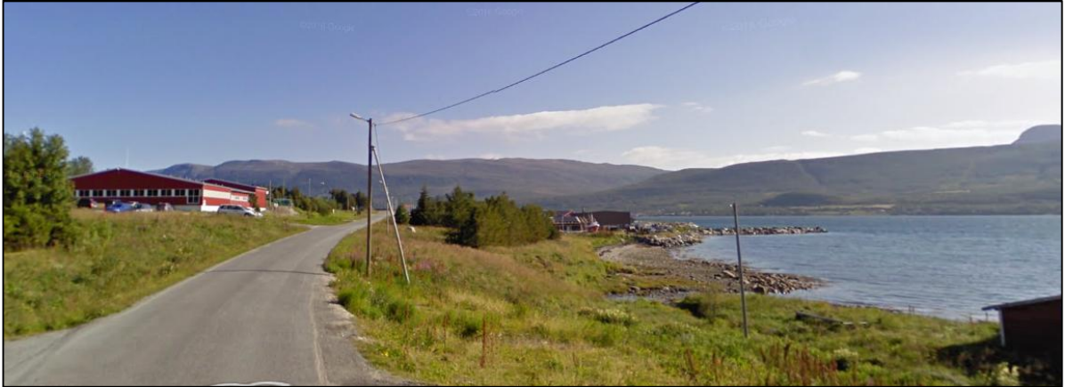
Figur 3: Planområdet nedenfor fylkesvegen på Hansnes

Ovenfor fylkesvegen ligger skole, idrettsbane og boligområder. Skolen bruker Grågårdsbuka i undervisning og bukta er et nærfriluftsområde på Hansnes. Det arrangeres årlig en dansefestival som bruker deler av Grågårdsbukta til sitt arrangement. Utvikling av havneområdet må sees i sammenheng med øvrige sentrumsfunksjoner.