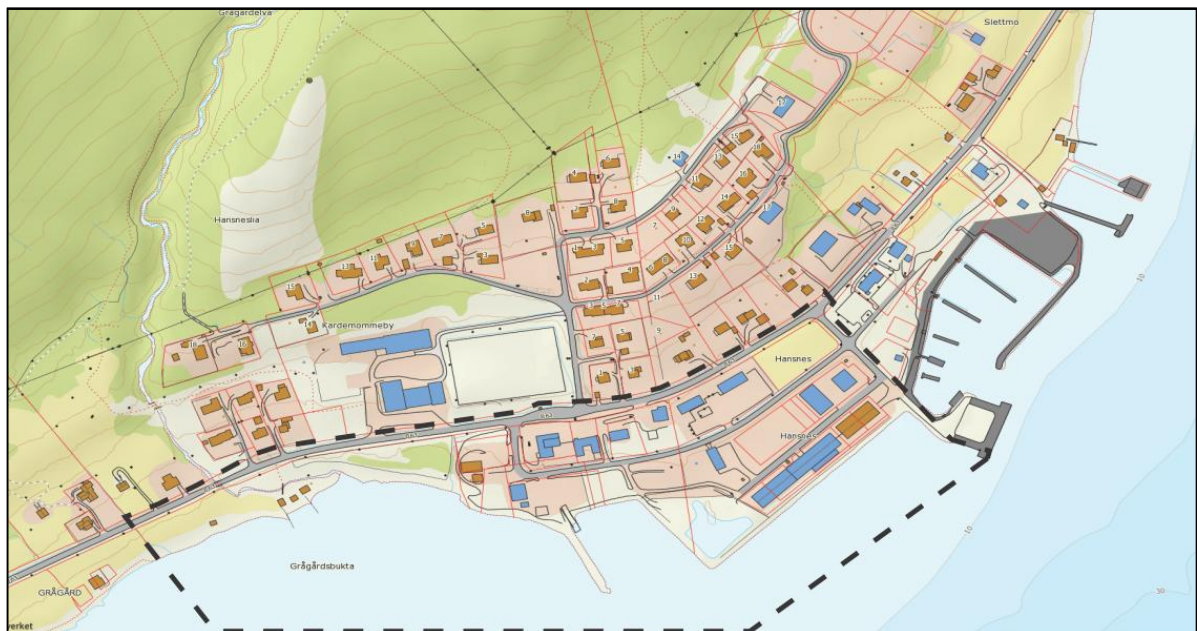
Figur 2: Avgrensning av planområdet

Planen avgrenses med fylkesveg 863 i nord, veg ned til småbåthavn i nordøst, nytt areal til utfylling i sjø i sørøst og eiendomsgrense vest for Grågardsbukta.