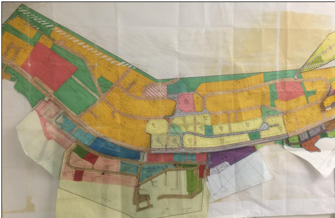
Figur 5: Reguleringsplaner på Hansnes, ikke fullstendig oppdatert oversikt