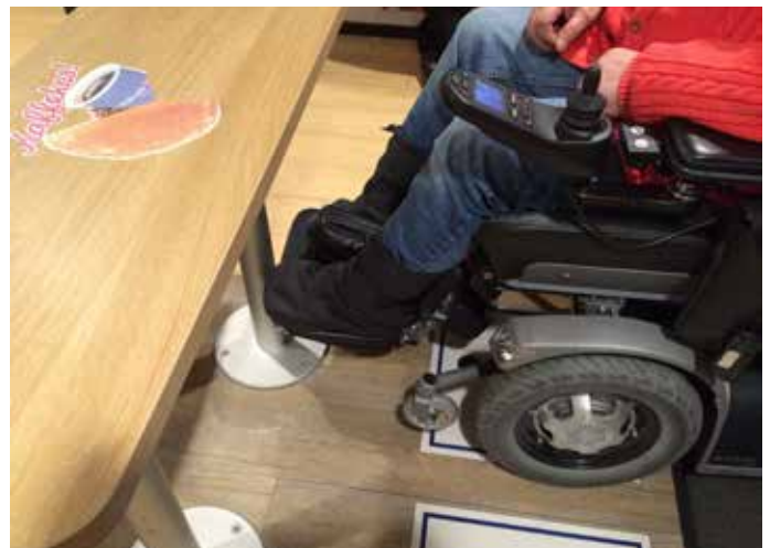
Merka bord til rørslehemma i salongen, men ikkje mogleg å bruke bordet i praksis, slik som det er sett opp pr. no.