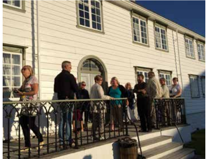
Omvising og festmiddag på Kjerringøy i samband med landskonferansen