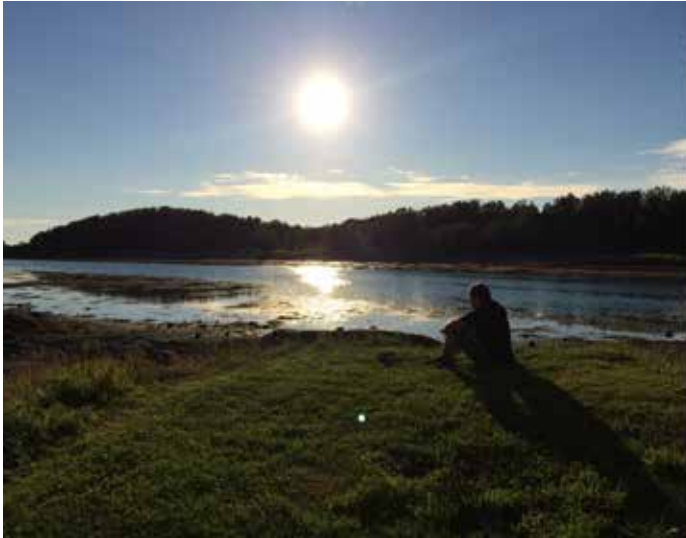
Nord-Norge viste seg frå si beste side under landskonferansen i Bodø 19. – 20. august 2015