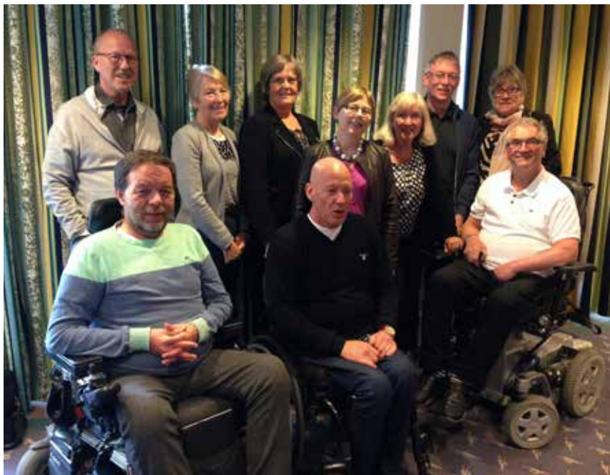
Deltakarane frå dei tre fylkesråda.

Prosjektet har vore medverkande til å få folk attende i jobb og studie