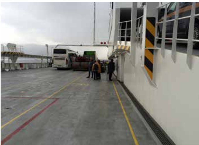
To oppmerka plassar til rørslehemma på Ampere