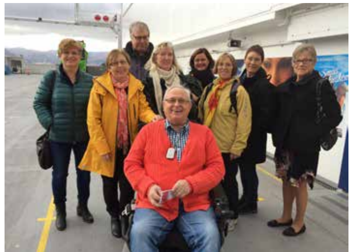
Fylkesrådet, brukarrepresentantar og representant frå Statens vegvesen