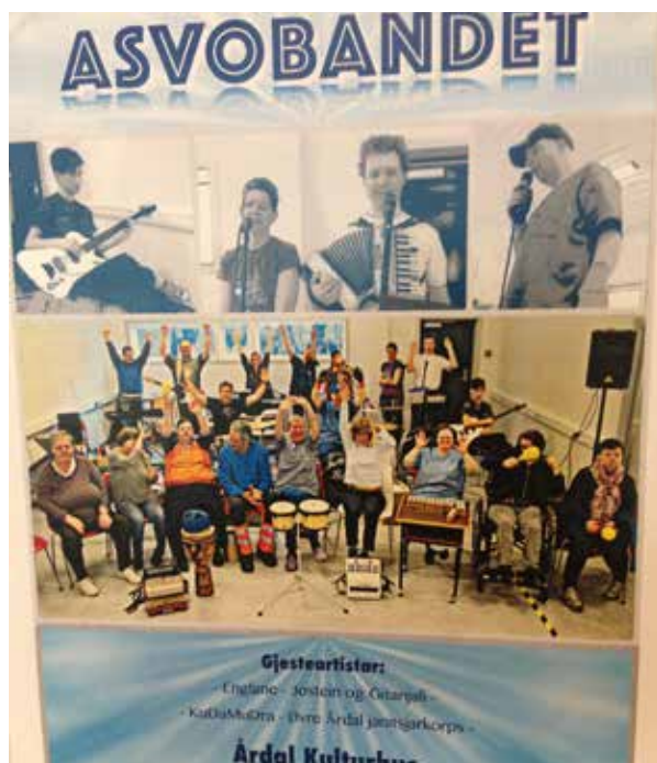
Asvobandet hadde tidlegare i månaden konsert i Årdal kulturhus, og hadde konsert under Målrock i august 2015.

Andre saker som var oppe til orientering og vedtak denne dagen var: oppsummering frå landskonferansen i Bodø, kven som reiser på SOR-konferansen i oktober, økonomiplanen 2016 –