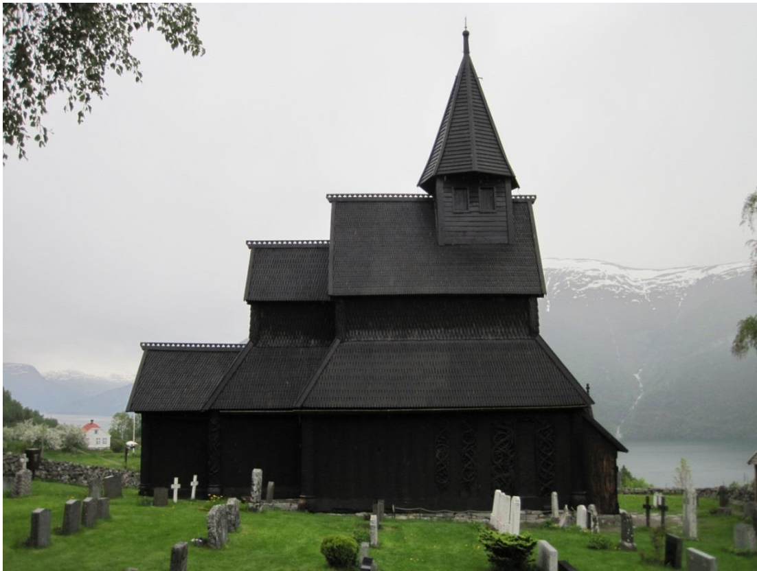
Figur 4. Urnes stavkyrkje og nordpotalen.