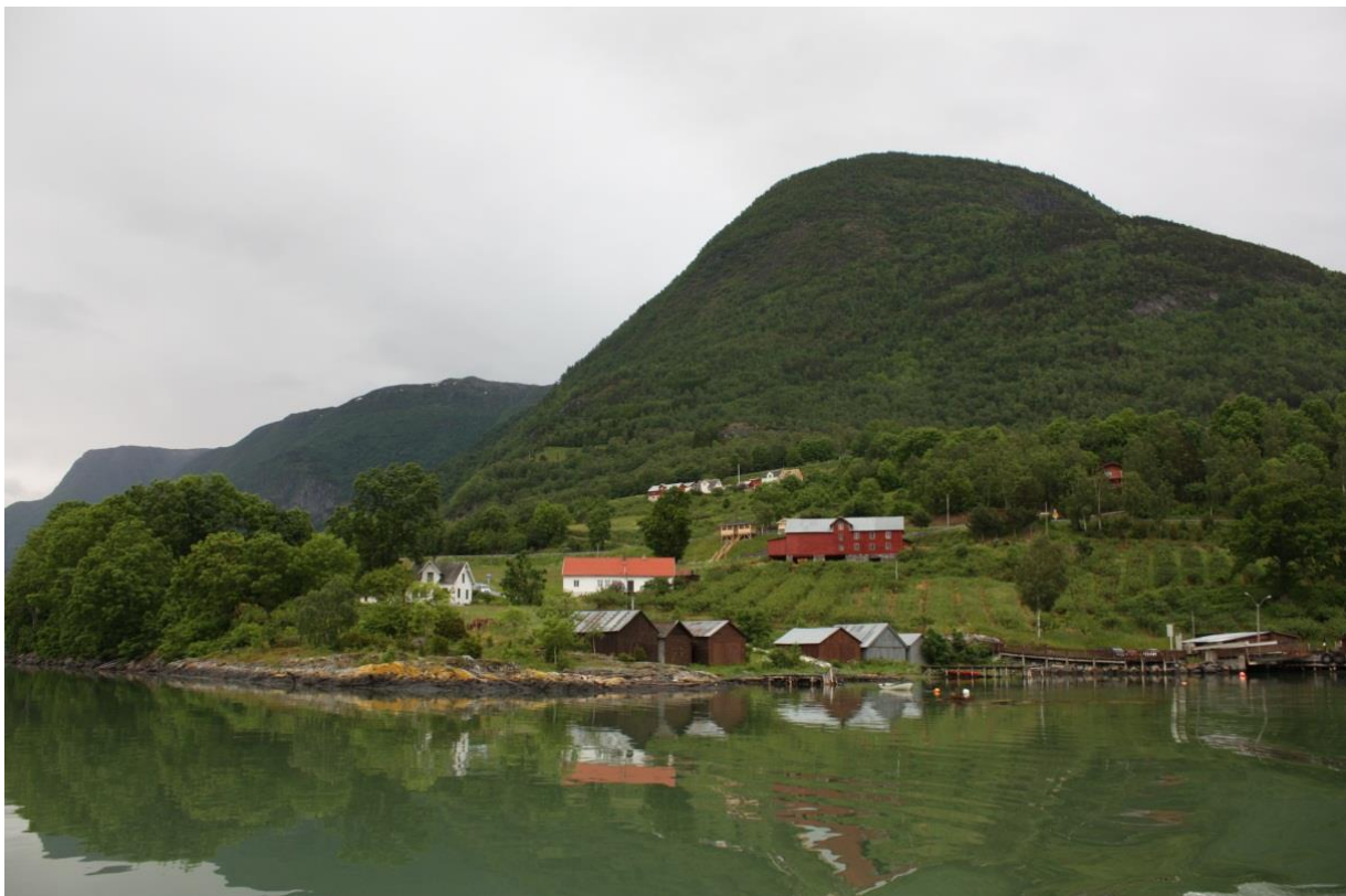
Figur 5. Naustrekka og tunet på Nedre Ornes med den karakteristiske raude driftsbygningen.

Blant dagens bygningar på Ornes, er det fleire bygningsmiljø som peikar seg ut som viktige i forhold til opplevinga av landskapet rundt stavkyrkja. Dei eldre bygningane i det gamle klyngjetunet og i området rundt stavkyrkja er viktige i forhold til opplevinga av stavkyrkja. Andre bygningsmiljø som, til dømes naustrekka ved sjøen, dei tuna som er synlege frå sjøen, og i traseen frå ferjekaia til stavkyrkja er viktige for opplevinga av Ornes.