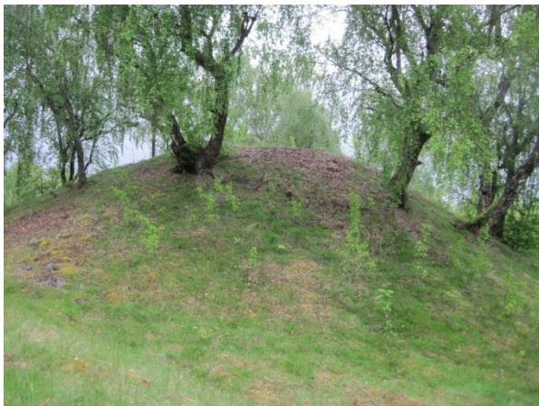
Figur 1. Ragnvaldshaug.

Dei eldste synlege kulturminna på Ornes er gravhaugane Skiphaug og Ragnvaldshaug, i tillegg til bautasteinen Høgesteinen, desse er alle automatisk freda. Den eldste av gravhaugane er Skiphaug.