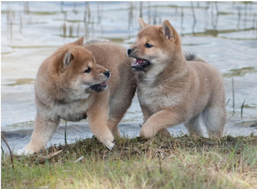
Lekende valper

Far: Aangenaam Suntory Hibiki Mor: Sakura Go Ichiokasow av Enerhaugen