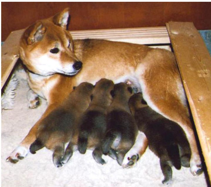
Mor og barn