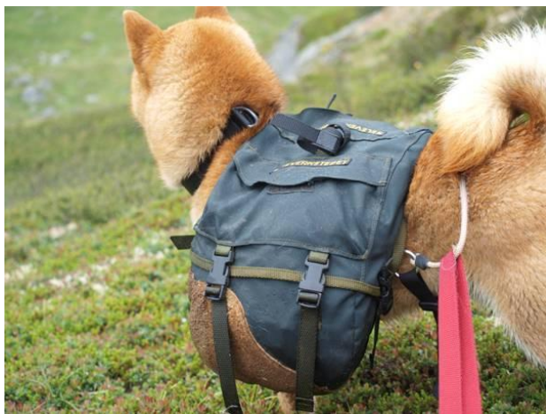
Turhilsen fra Morten N Olsen

I skrivende stund nærmer det seg påskeferie, håper snøen holder seg slik at vi nok engang kan nyte 2 uker på Hardangervidda med våre tre firbeinte.