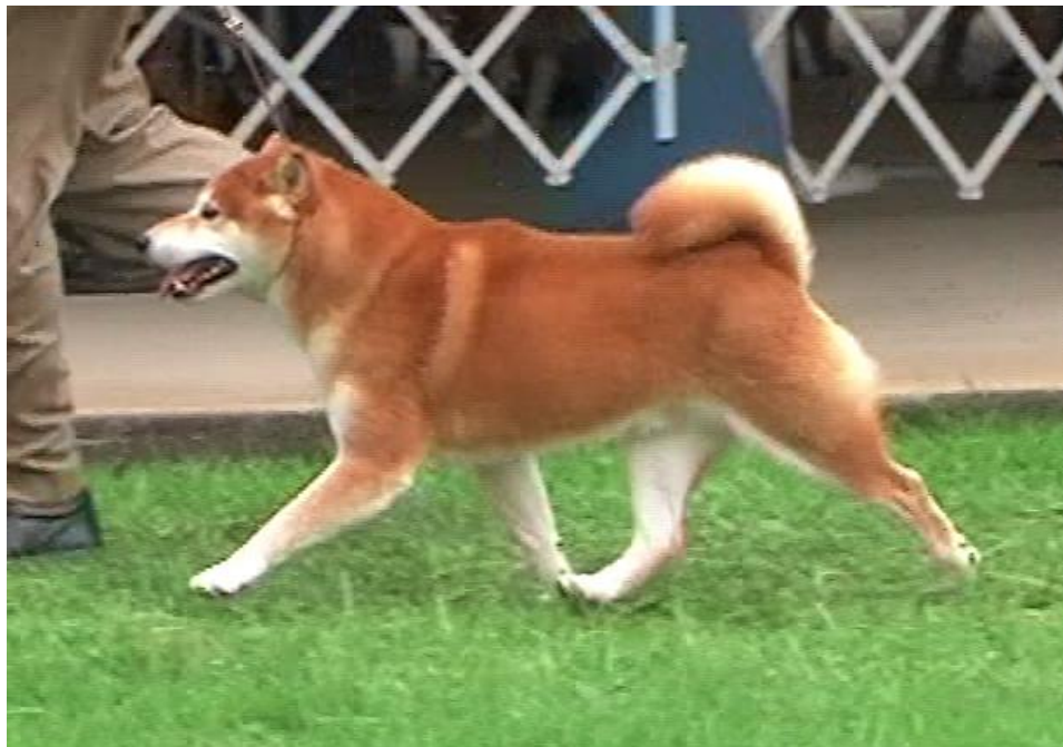
Bildet viser en shiba med rasetypiske bevegelser

Som nevnt over er en hund som beveger seg korrekt en hund som er riktig bygget. Derfor er det viktig å bedømme hundens bevegelser. Jeg mener at Nippo i dag legger for lite vekt på bevegelser. Dette kommer av at da Nippo ble grunnlagt var hovedformålet å bevare den japanske hunden og luke ut de elementer som ikke var typisk. Å bedømme hundens helhet har vært det viktigste og bevegelser har ikke fått spesiell oppmerksomhet. I dag har vi nådd målet med å bevare den typiske japanske hunden. Da er det etter min mening på tide å sette mere fokus på bevegelser.