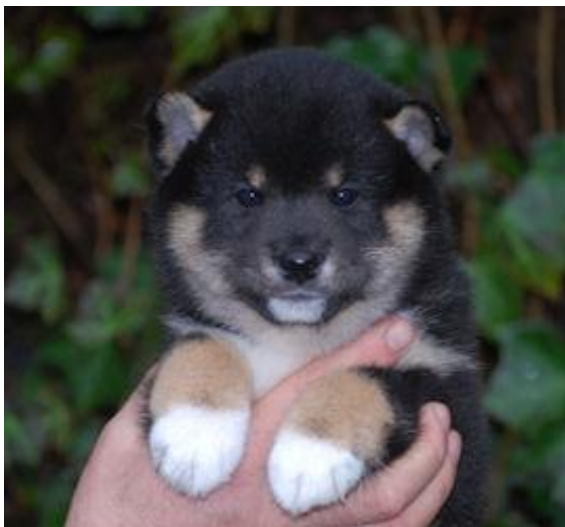
Ryuukurofuji av Enerhaugen. Siste skudd på stammen.

Nytt år, nye muligheter, nye valper! Flere spennende kombinasjoner planlagt fremmover. Kontakt oss gjerne for informasjon eller ett besøk.