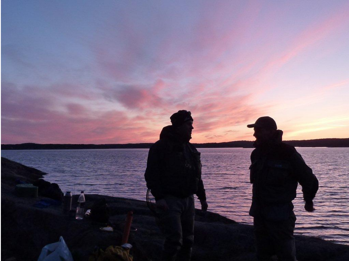
Islendingen og jeg eller meg og Islendingen