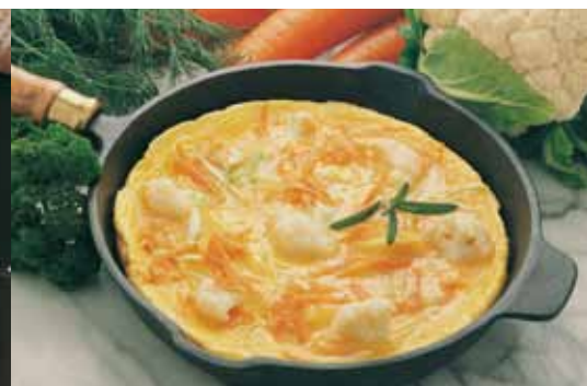
OMELETT - GRØNNSAK-PANNE