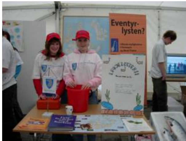
Karlsøy-ungdommer på stand for kommunen under Fiskeridagan i Tromsø 2005