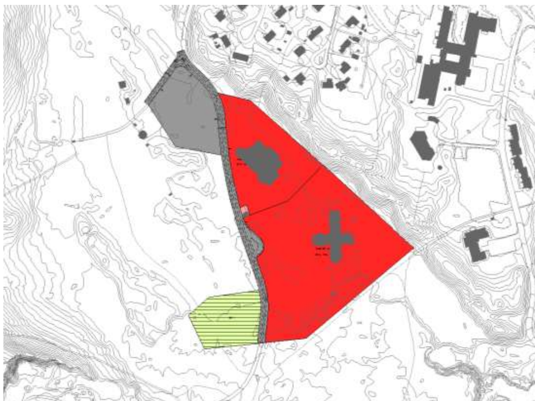
Skisse 1: Eksisterende reguleringsplan for sameskole og flerbrukshall, Tana bru.

Endringene framgår av skisse 1 og 2 nedenfor.