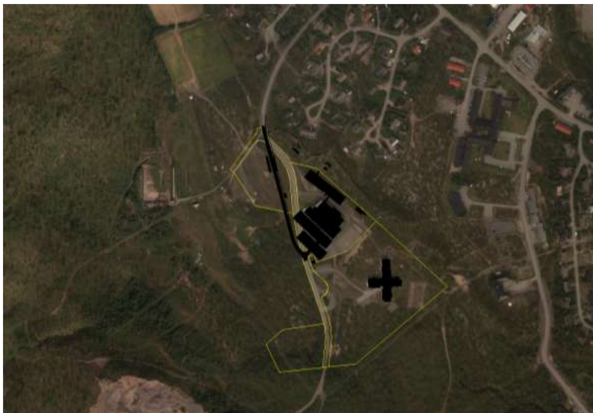
Skisse 2: Ortofoto med de foreslåtte endringene i veitrasé, bygningsmasse og parkering tegnet i svart. Formålsgrensene i eksisterende reguleringsplan tegnet i gult. Kunstgressbanen vises ikke på dette fotoet. Den ble først etablert i 2012.