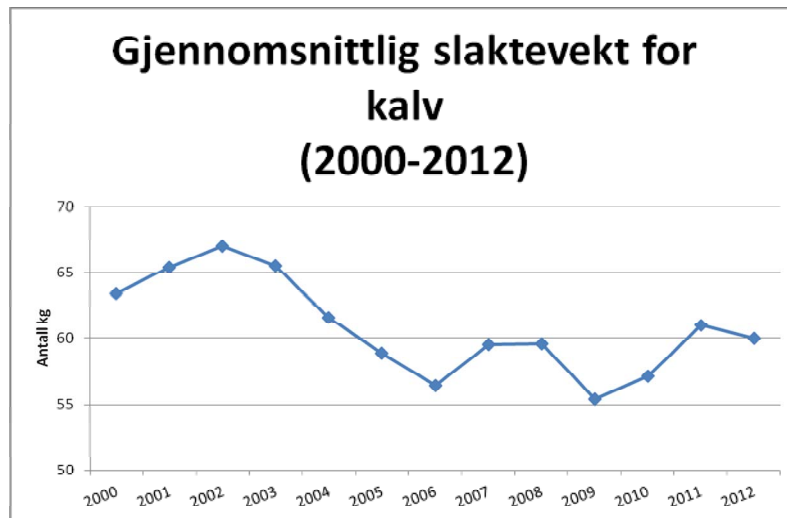
Fig 3. Gjennomsnittlig slaktevekt for kalv (2000-2012).

Når det gjelder kalveproduksjonen basert på sett-elg data, så har indeksene for sett-kalv per ku og sett kalv per kalvku vært stabile over mange år og ligger innenfor normalverdier. Andelen ku med kalv har økt noe i 2011-2012, og ligger nå på omtrent samme nivå som tidlig på 2000 tallet (62%).