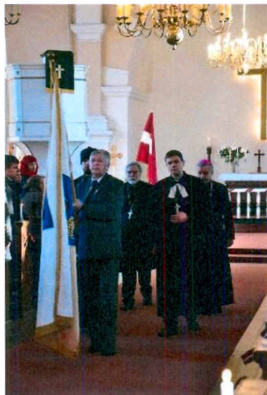
Foto: Iesvēta Jelgavas novada karogu

Valsts proklamēšanas 93. gadadienu sagaidot, 17. novembrī Sv. Annas evaņģēliski luteriskajā baznīcā notika ekumēniskais svētbrīdis par godu novada karoga iesvētīšanai. Pēc pasākuma baznīcā karogs tika svinīgi pacelts karogmastā pie Jelgavas novada pašvaldības ēkas.