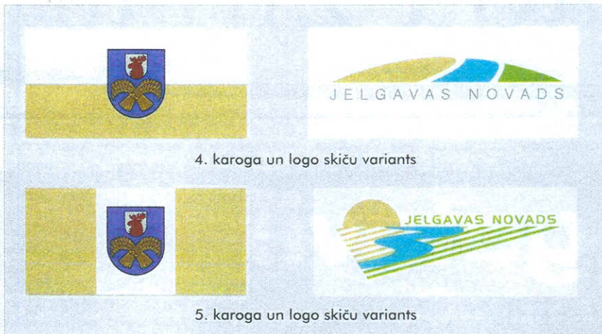
4. karoga un logo skiču variants