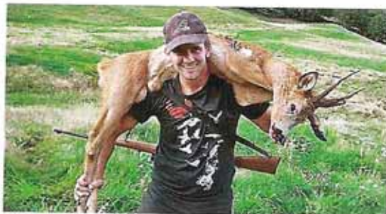
RÅDYRJAKT: En av disse kan du risikere å treffe på i Lysebotn. Det gjorde denne karen!