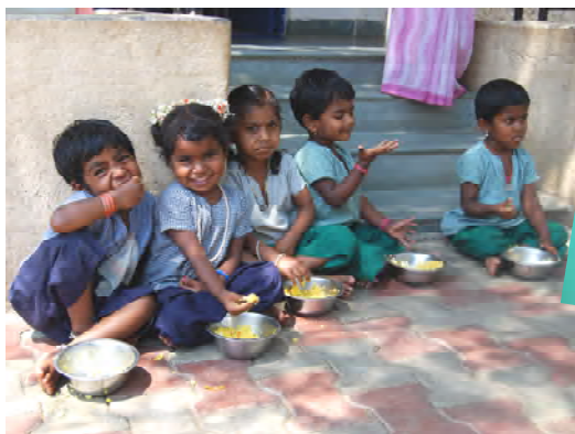
Fra en av APSAs barnehager