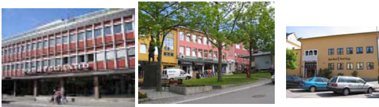
Gjenreisningsbygg fra etterkrigstiden. Status regulering: Reguleringsplan godkjent 2002 Krav til regulering: Opprettholdes

Ny status: Fasader på Storgt. 26, 28 og 30 er påbygd og renovert med et glassbygg mot torget.