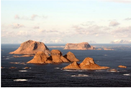
Foto: Fantastisk utsikt på klare dager for fugletellere i fly. Her ser vi Trenyken med Røst i bakgrunnen.

De tellingene som Systad nylig har vært med å gjøre over Lofoten og Vesterålen er spesielt viktig for ei offensiv olje og gassnæring som presser på for å starte leiteboring i området. Ved å fremskaffe og vedlikeholde grunnleggende kunnskap om sjøfugl bidrar det til en bedre forvaltning av disse marine miljøene. Det gjør det mulig å modellere effekter av menneskets inngrep og skille disse fra det som primært skyldes naturlig variasjon.