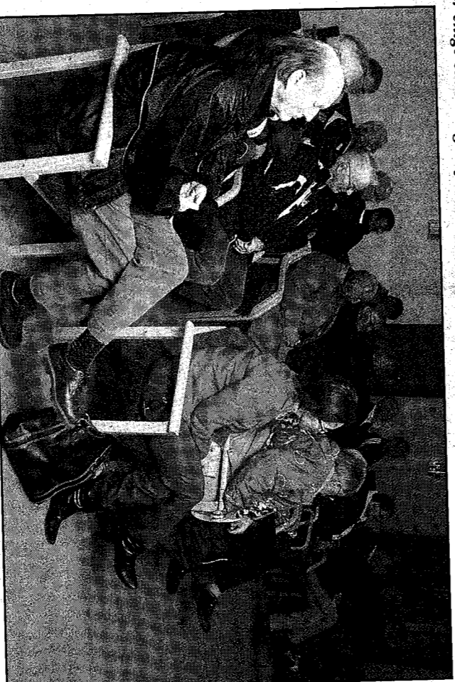
25-26 personer var til stede på informasjonsmøtet.